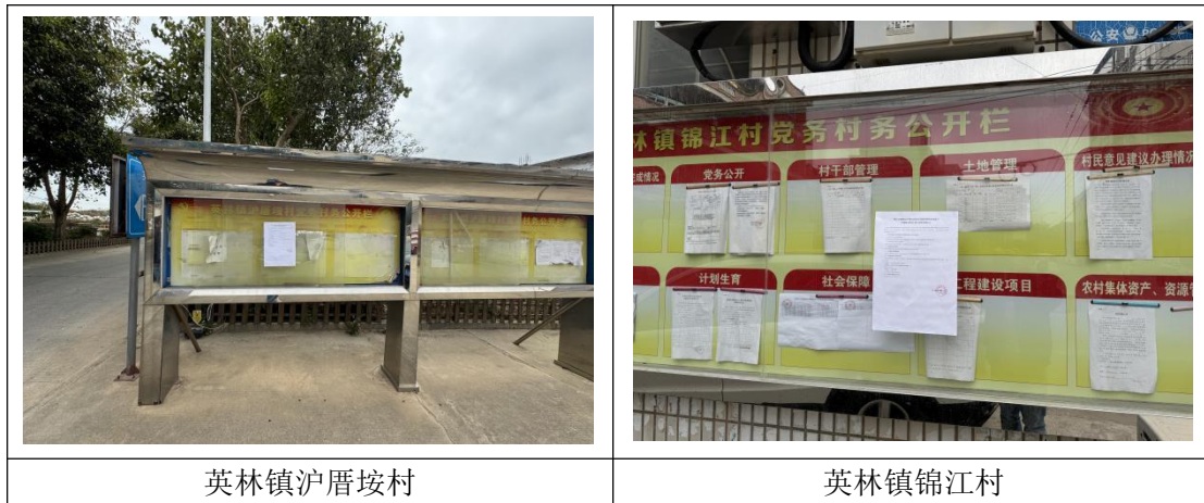
图 3.2-3 现场张贴公示照片