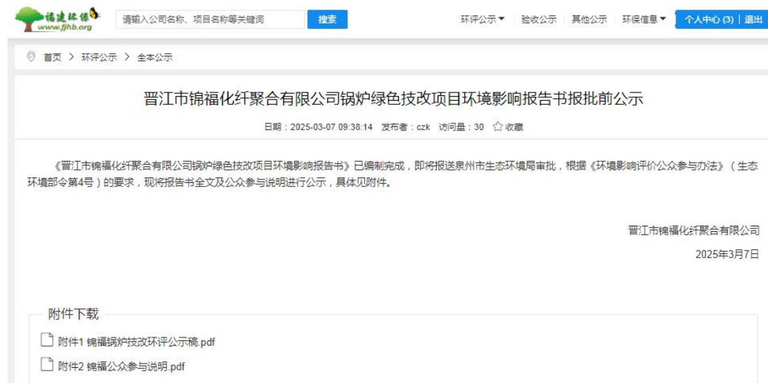
图 6.2-1 报批前公开截图

本次报批前公开按照《环境影响评价公众参与办法》的要求，于2025年3月7日在福建环保网（ https://www.fjhb.org/huanping/quanben/37305.html ）进行，公示截图见图6.2-1。