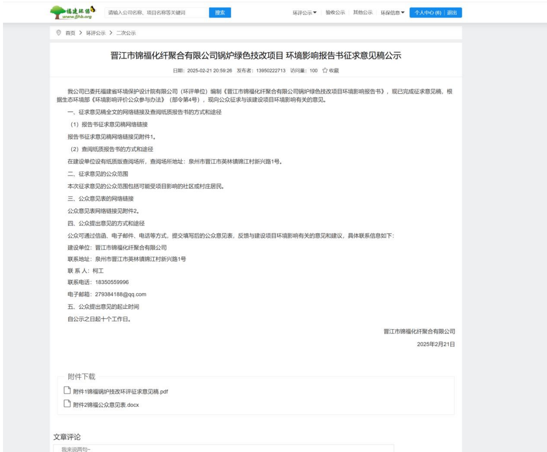
图 3.2-1 征求意见稿公示信息截图