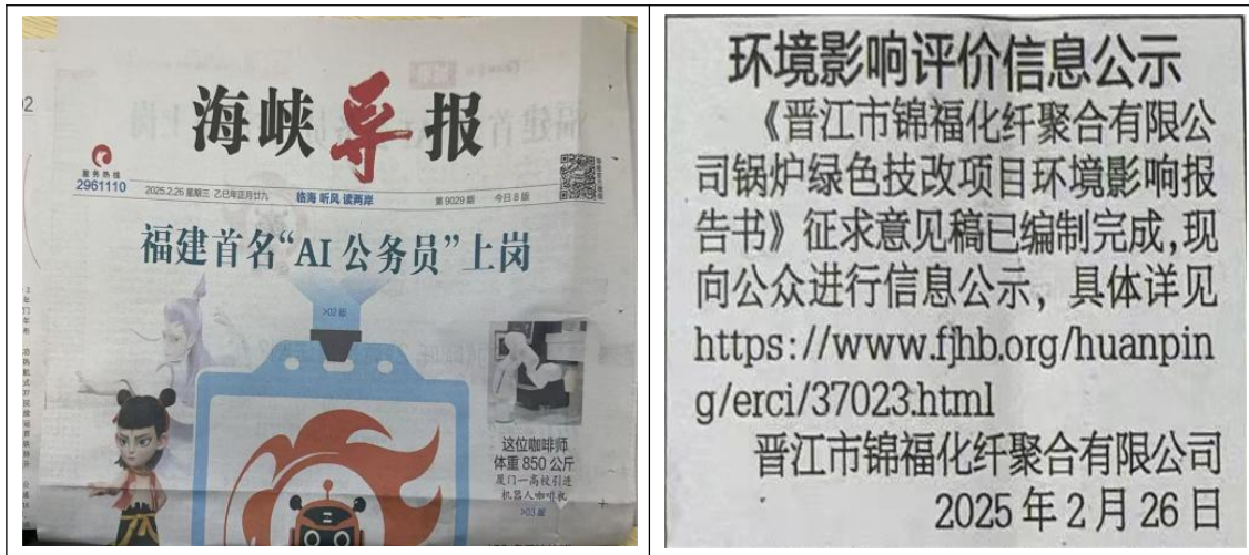
图 3.2-2 海峡导报公示照片