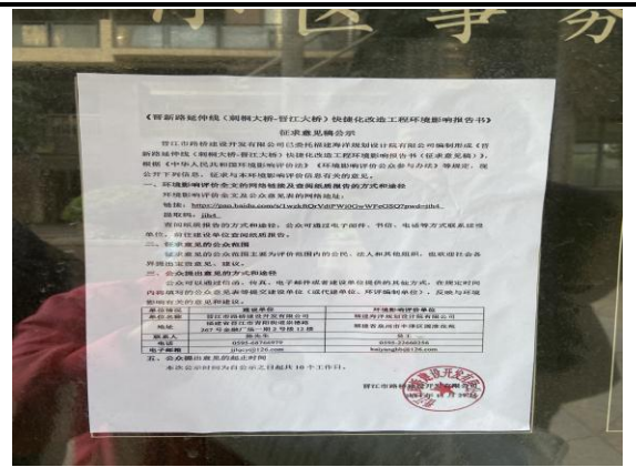
泉州世界贸易中心 B 区张贴情况（特写）