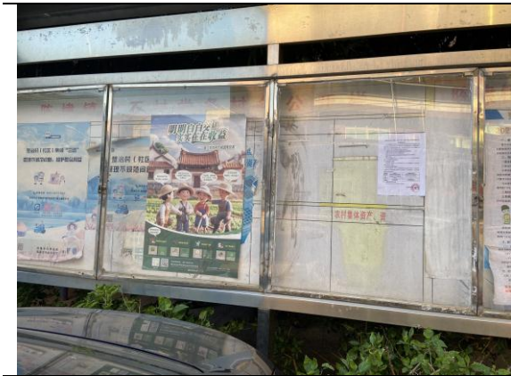
仙石村张贴情况（远景）