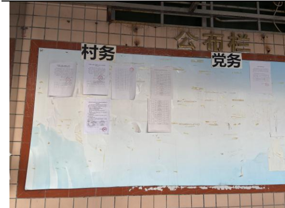
海尾村张贴情况（远景）