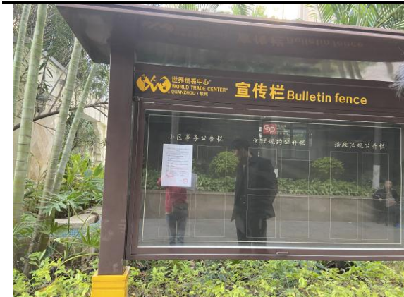
泉州世界贸易中心 B 区张贴情况（远景）