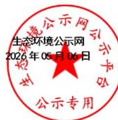
图 7.1-1 项目名称变动公告