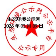
图 3.2-1 第二次环评信息网上公示