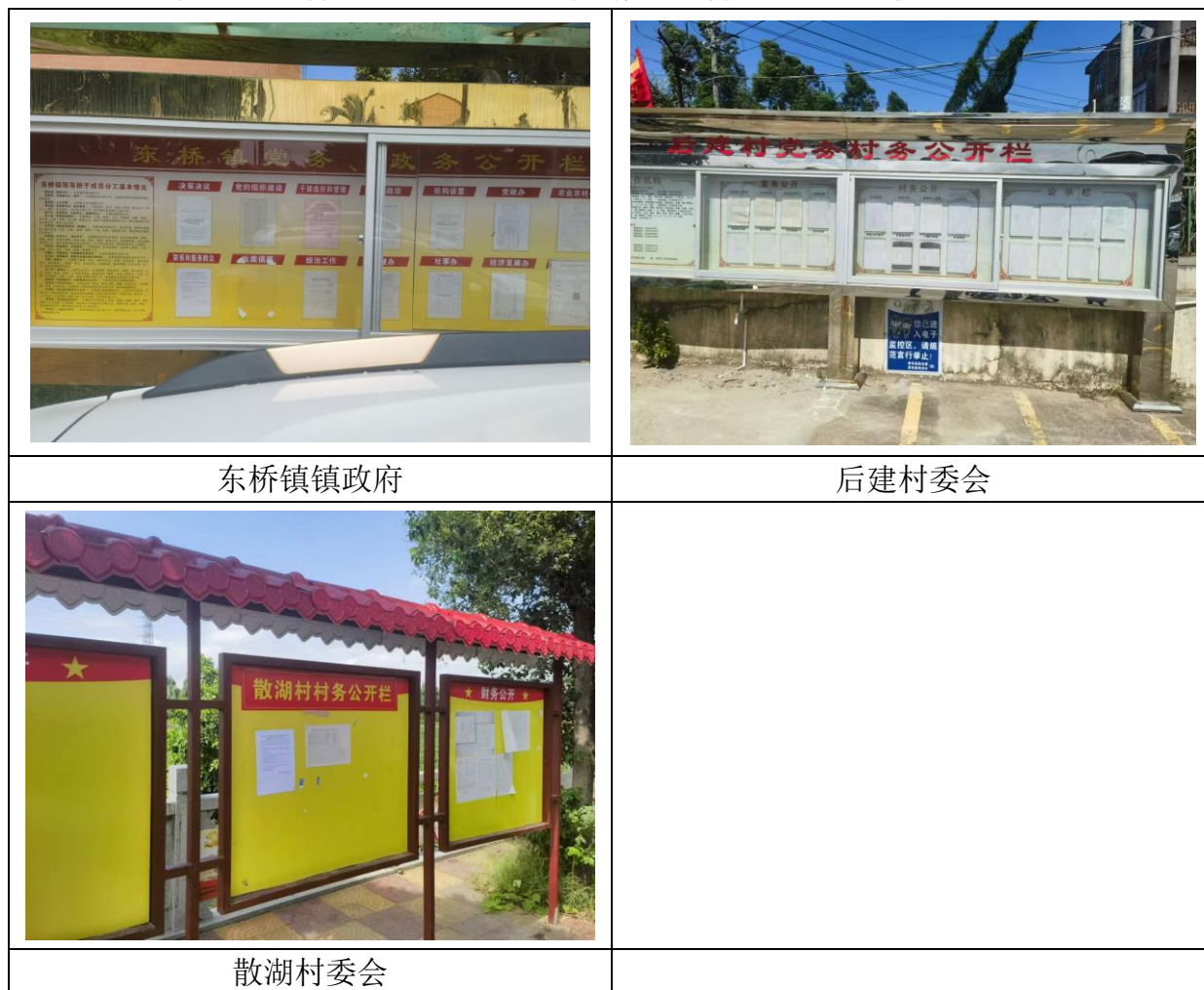
图 3-3 项目征求意见稿全文信息张贴照片

后建村、散湖村村委会及东桥镇镇政府等均是项目所在地公众于知悉的场所，作为项目公示张贴场所，符合《环境影响评价公众参与办法》关于张贴场所的要求。