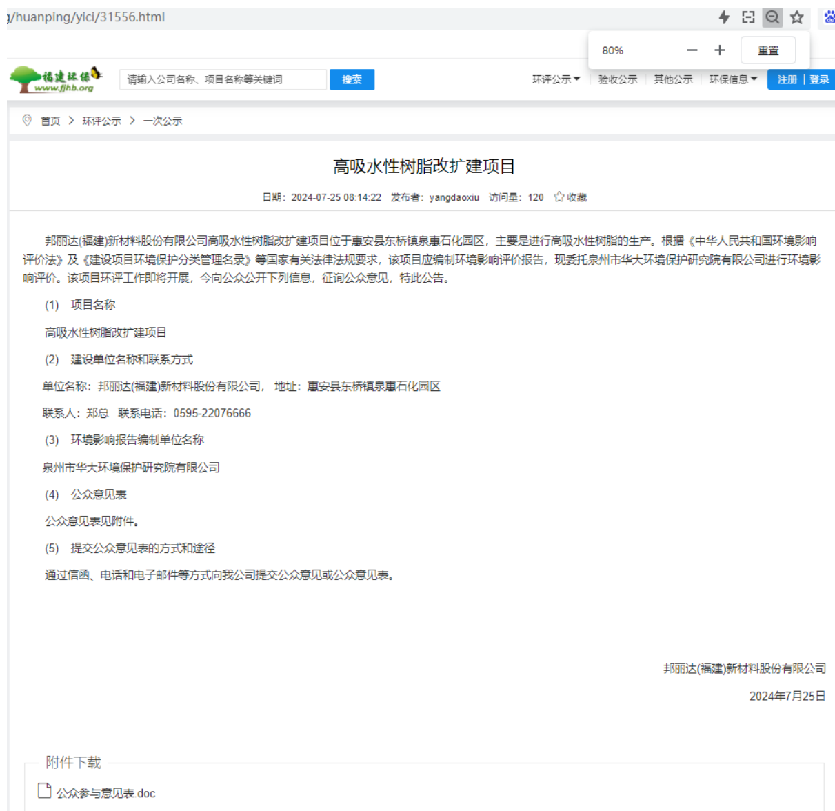
图 2-1 项目编制环境影响报告书信息网络公示截图

公示网站为福建环保网站，作为项目公示网络平台，符合《环境影响评价公众参与办法》关于网络公示媒介的要求。