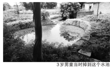
3岁男童当时掉到这个水池

当时有莆仙戏演出,他正在弹琴;男孩被救起时完全昏迷,经急救后送医,今天可康复出院