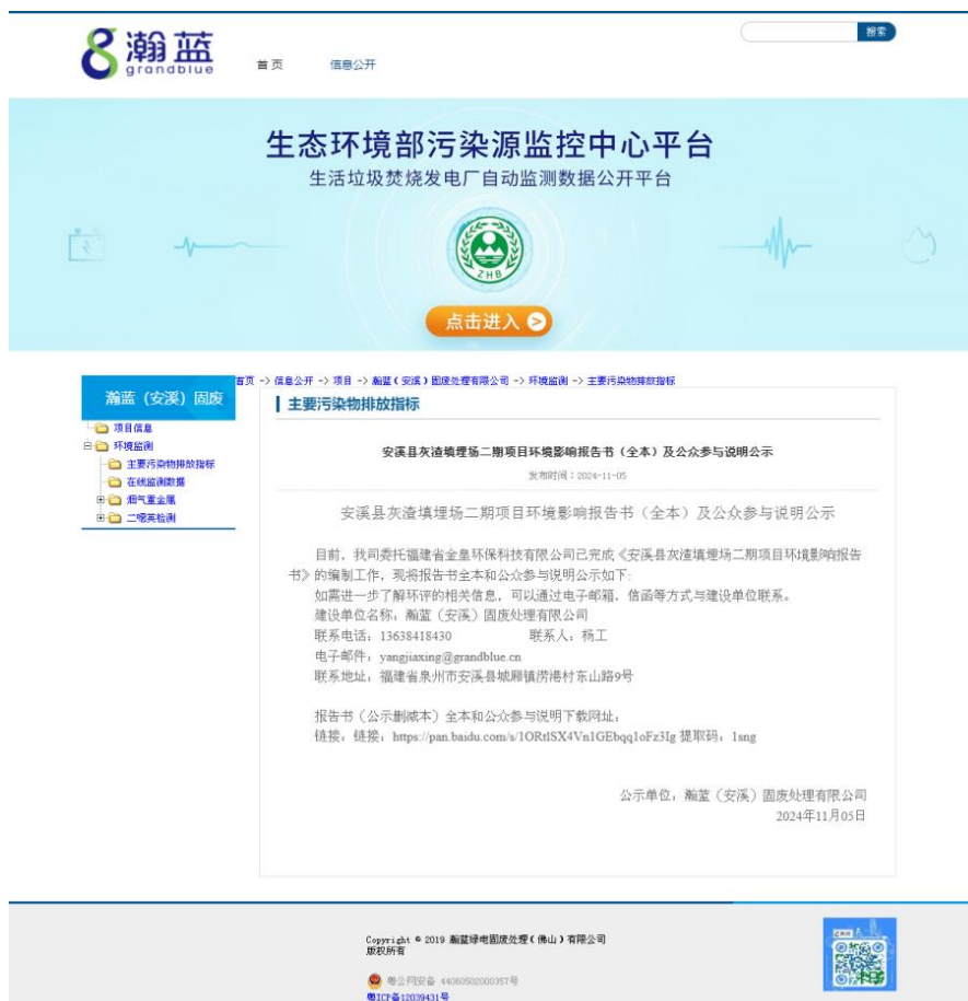
图 6.1-1 环评报告及公参说明报告全文公示截图

我司于2024年11月05日，在瀚蓝公司网站（ https://info.nhgre.com/contents/104/1963.html ）对本项目的环评报告书（送审稿）以及公参说明报告进行全文公示，此次公开的全本报告中删除了包含国家机密、商业机密、个人隐私等不应公开的内容。