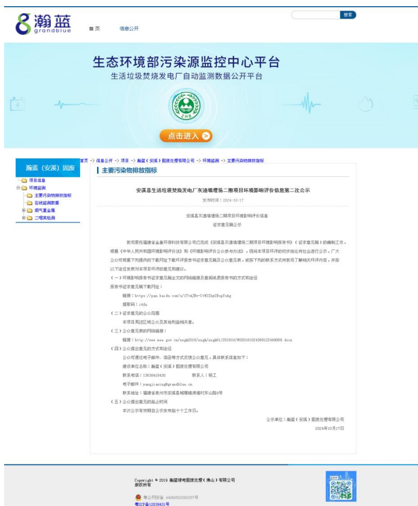
图 3.2-1 征求意见稿网络公示截图

《海峡导报》由福建日报报业集团主管主办, 经国家新闻出版署批准, 于 1999 年 3 月 9 日在厦门特区正式创刊, 是闽南地区发行量最大的市民生活报, 因此适合作为本项目的报纸公示媒介。