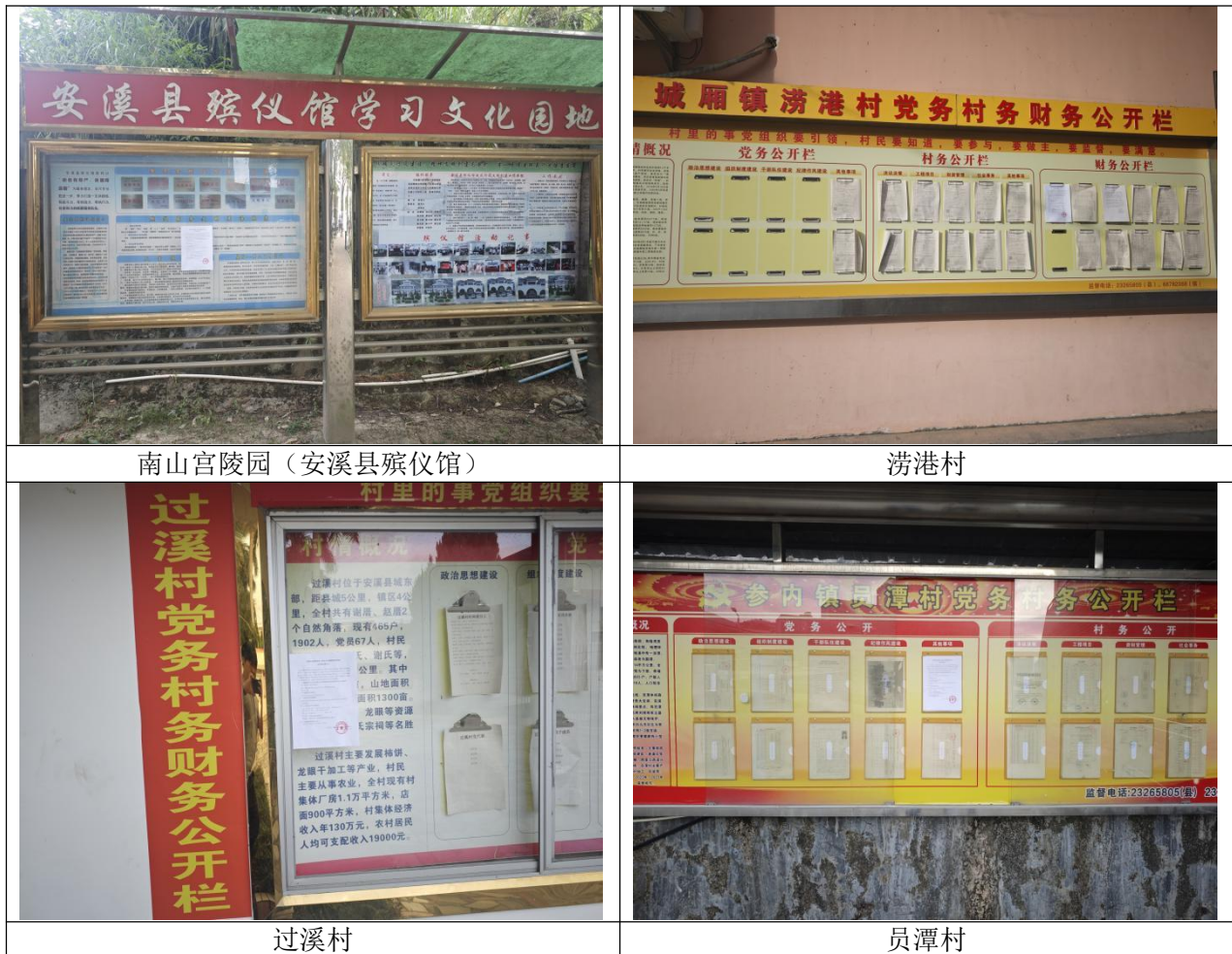
图 3.2-4 征求意见稿公示现场公示照片

我司在项目周边的南山宫陵园（安溪县殡仪馆）、涝港村、过溪村、和员潭村等地进行了现场张贴，基本覆盖了项目可能影响到的区域，张贴时间自2024年10月17日起的10个工作日，符合《环境影响评价公众参与办法》第十一条的要求，详见图3.2-4。