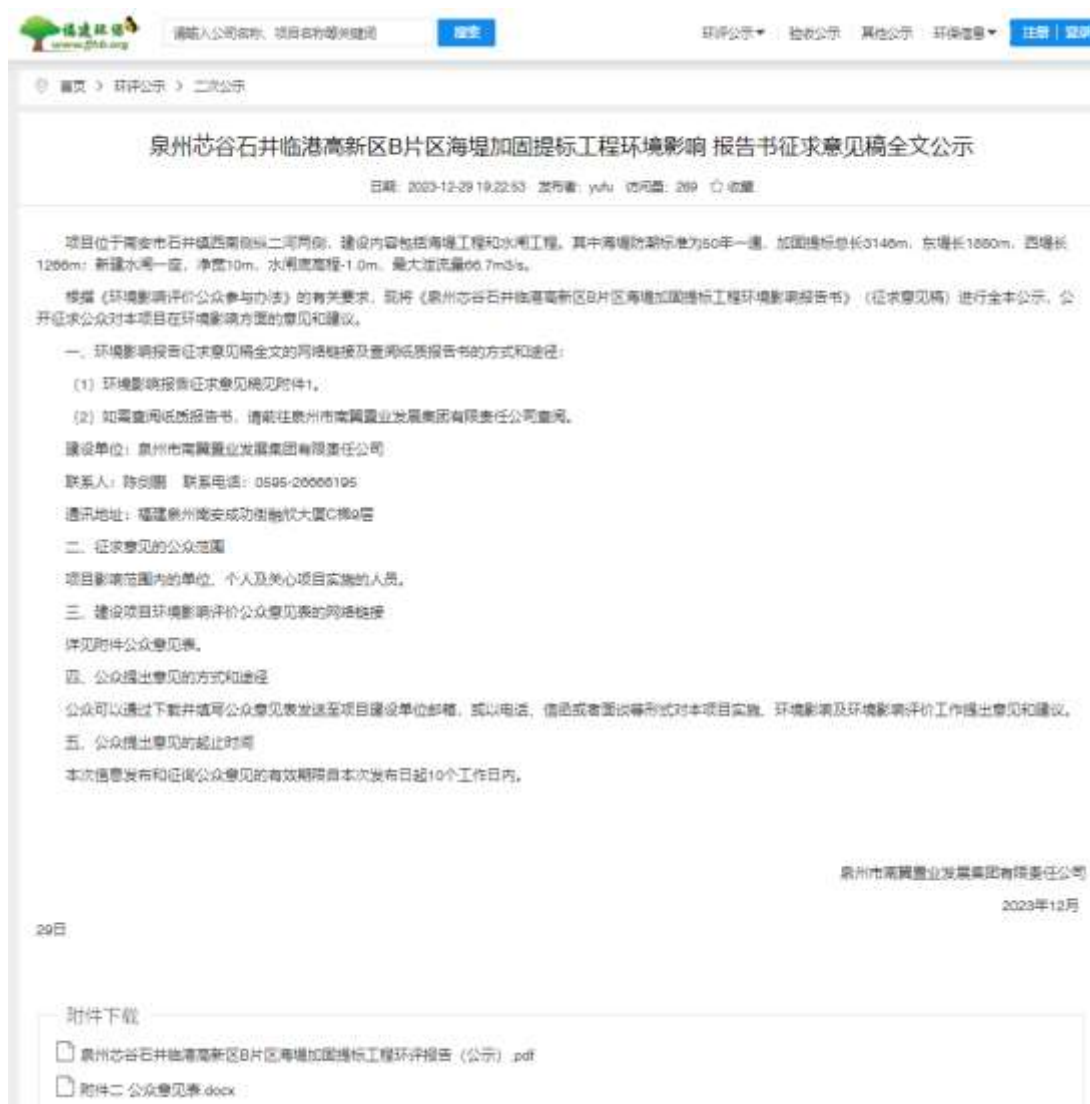
图 3.1 2023 年 12 月 29 日至 2024 年 1 月 16 日征求意见稿全文的网络公示