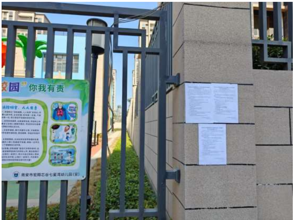
图 3.4 征求意见稿全文的现场公示