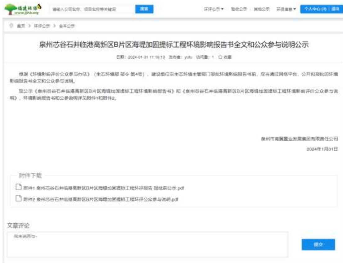
图 6.1 拟报批环境影响报告书全文和公众参与说明网络公示