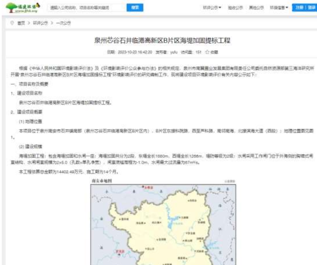
图 2.1 2023 年 10 月 23 日网络第一次信息公示