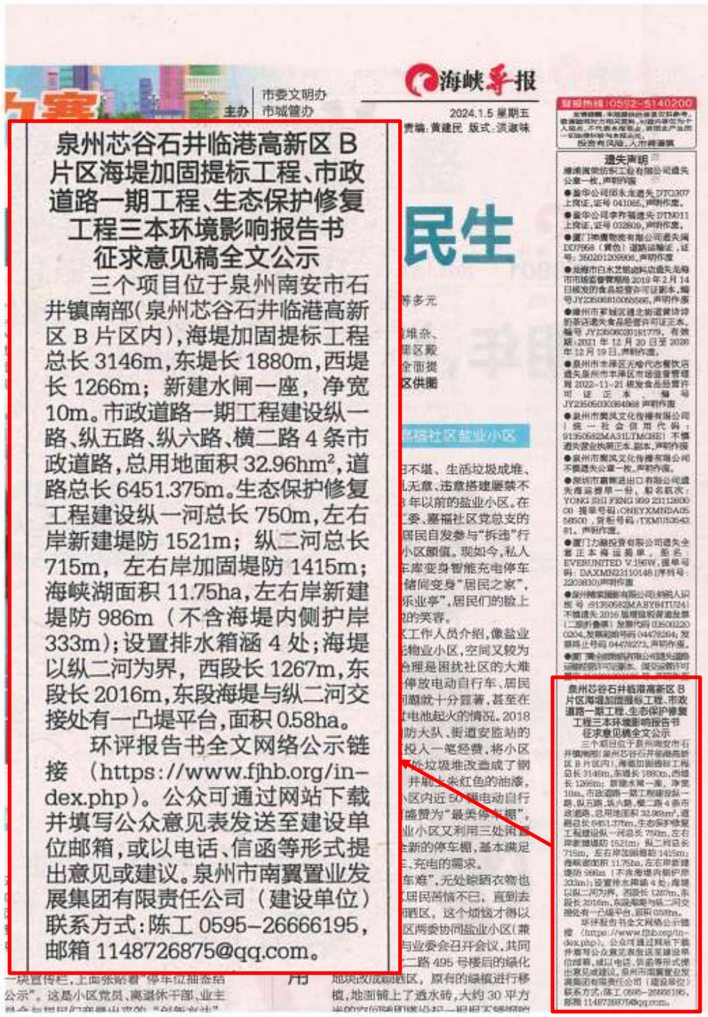
图 3.2 征求意见稿全文的第一次报纸公示