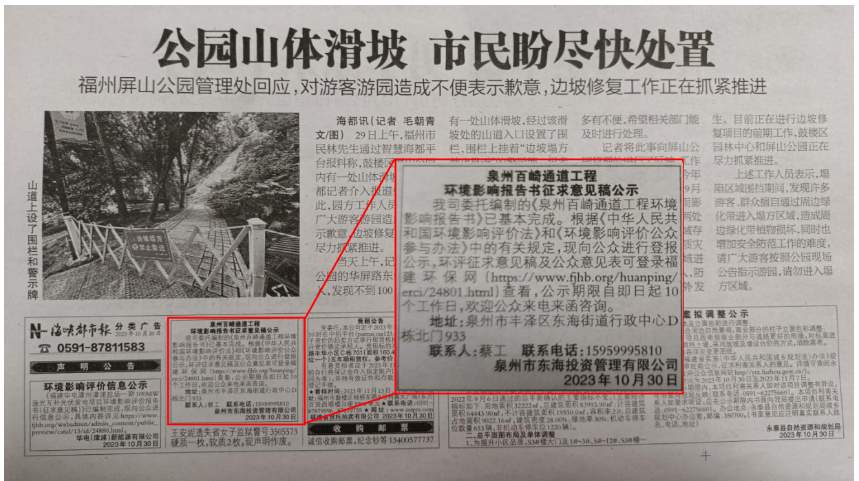
图3-3 本项目环评信息第二次在《海峡都市报》公示（2023年10月30日）