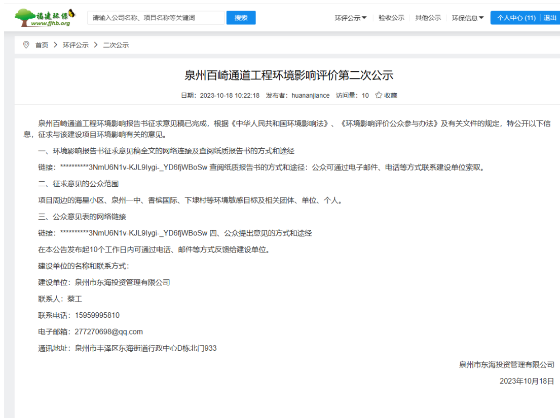
图3-1 项目征求意见稿网上公示截图