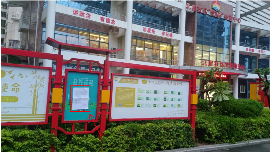
图3-6 海星小区（北星社区）公开栏公示