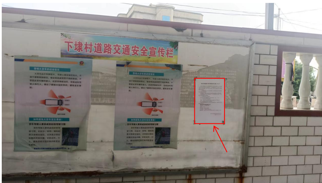
图3-5 下埭村道路交通安全宣传栏公示