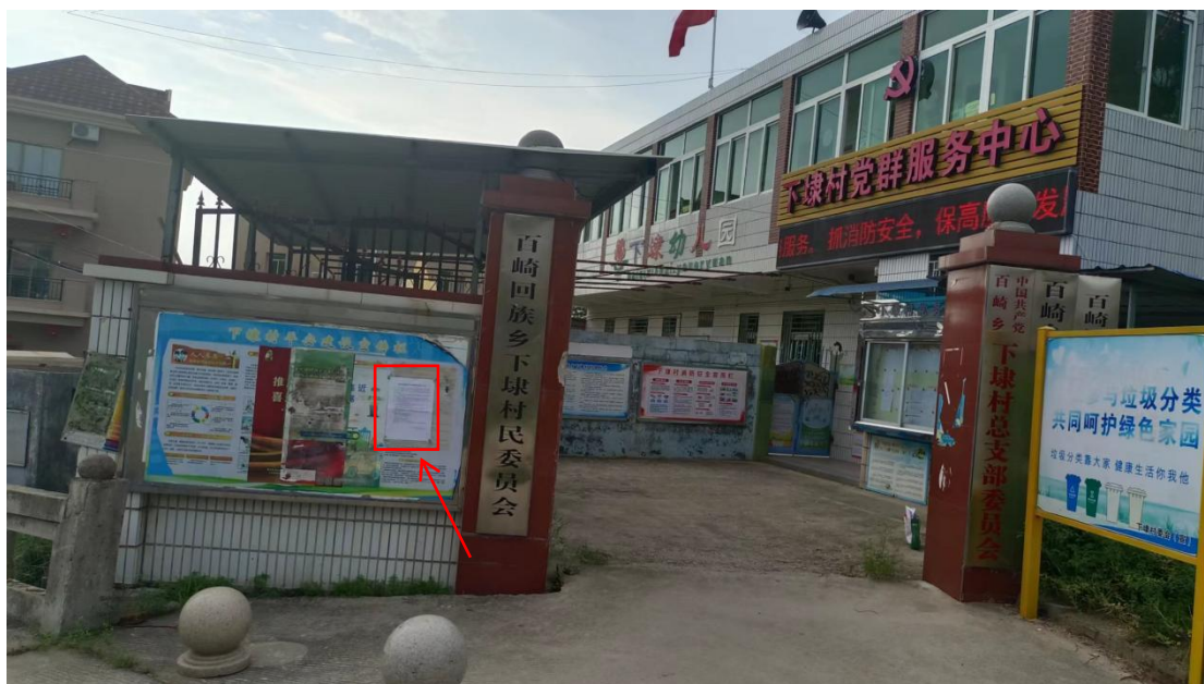
图3-4 下埭村党群服务中心宣传栏公示