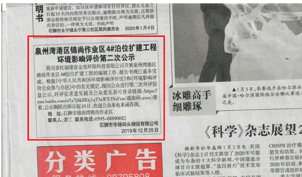
图 3.2-3 1月4日征求意见稿报纸公示截图