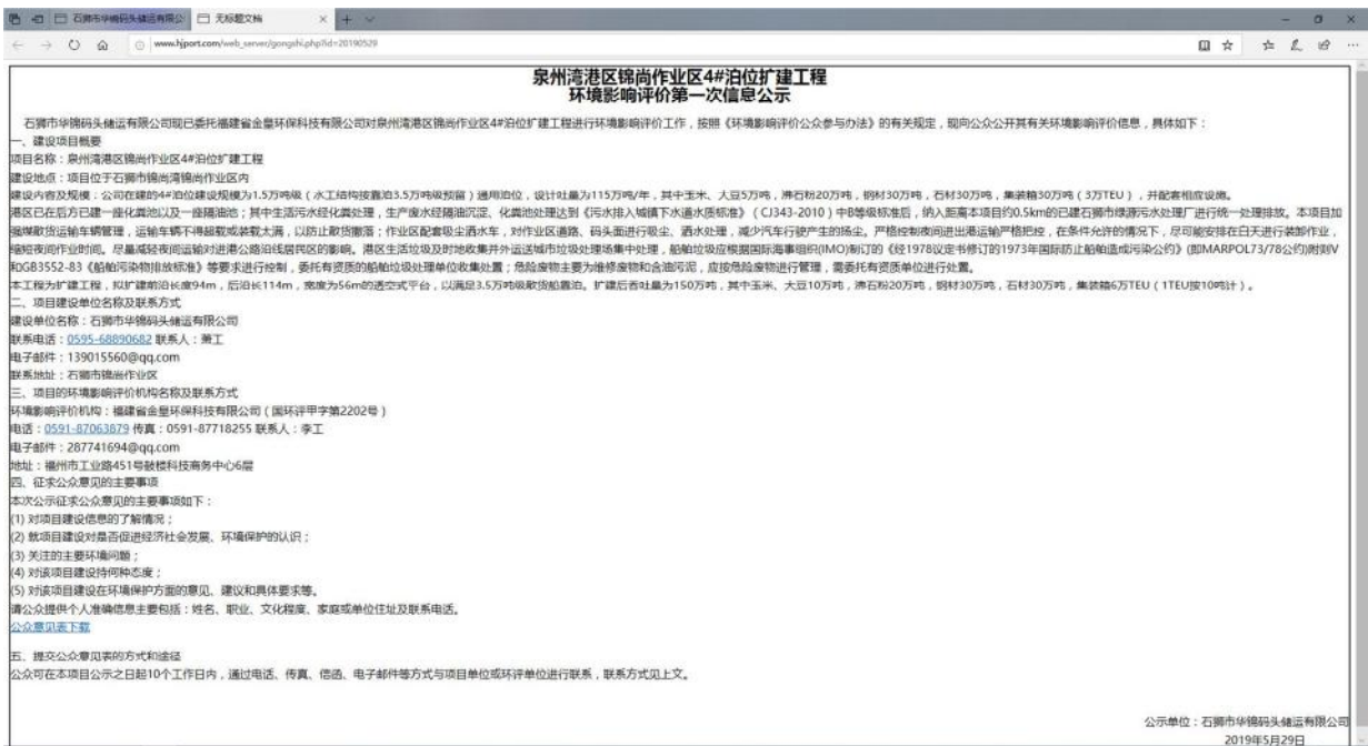
图 2.2-1 石獅市華錦碼頭儲運有限公司網站第一次網絡公示截圖