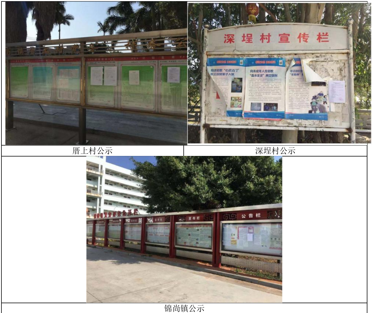
图 3.2-4 征求意见稿现场张贴公示照片