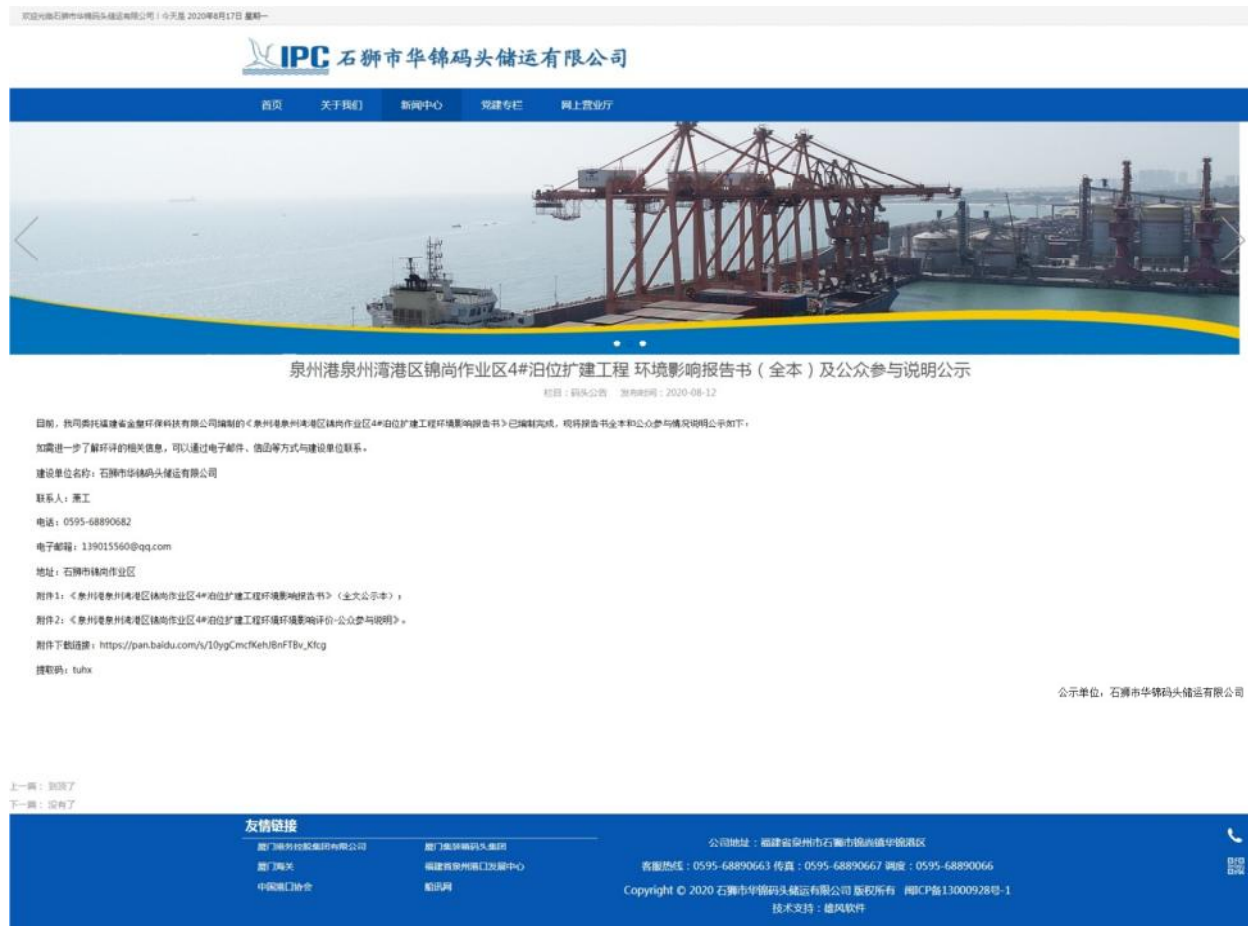
图 6.2-1 全本公示截图

石狮市华锦码头储运有限公司属于建设单位的网站，因此适合作为本项目的网络公示媒介，符合《环境影响评价公众参与办法》第二十条的要求。