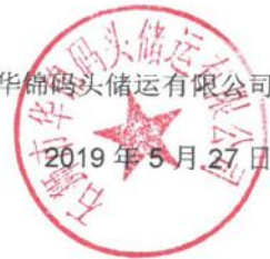
图 2.2-2 本项目环评委托书